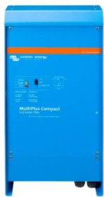
MultiPlus Compact 12/2000/80

Se puede acceder a los datos y cambiar los ajustes de los sistemas con un panel Color Control si está conectado a Ethernet.